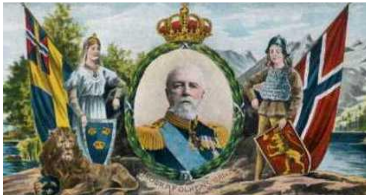
Svensk brevkort i anledning Oscar IIs 75-årsjubileum i 1904, med kongens motto: «Brödrafolkens väl».

De nasjonale symboler og ritualer er mange både i Norge og Sverige, og de har en lang historie. Også den svensk-norske unionen 1814-1905 etablerte sine symboler – et unionsflagg, et unionsvåpen, portrettet av den felles konge - og fikk sin unionsdag – 4. november. Så sent som i 1904 ble unionens 90-årsdag forsiktig feiret i begge land. Men hvordan var forholdet mellom unionens og de to nasjonenes symboler og ritualer, hva formet de nye unionssymbolene, og hvordan ble det nasjonale og unionelle påvirket under brytningene mellom de to? I dag er unionen og dens symboler og ritualer for lengst forsvunnet, og det nasjonale står under press, også fra en union av europeisk format, som forsøker å utbre sine egne symboler, som EU-flagg, -dag og -sang.